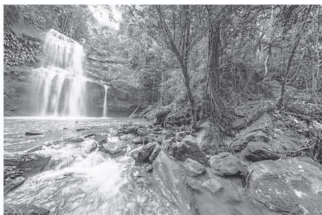
Figura 5. Reserva Natural El Danubio-Morelia Caquetá.