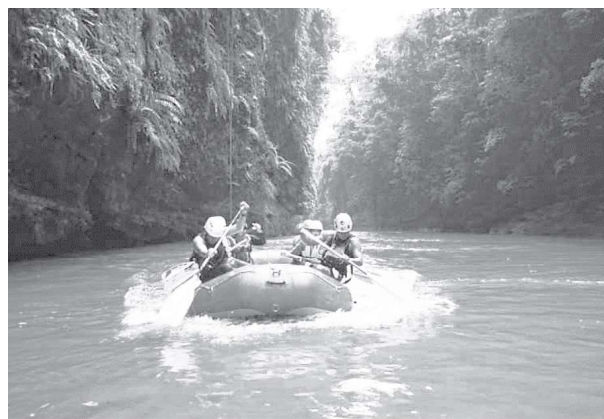
Figura 2. Cajones Río Pato.

plantea, pero de manera incipiente. Actualmente hay dos comunidades que están surgiendo, a través de la creación de senderos alrededor de sus cultivos, según información de la oficina de Turismo. En Florencia se ofrece turismo de aventura, como rafting , torrentismo , cañoning y ecoturismo. Se tiene senderismo de observación de fauna y flora y avistamiento de aves, cuyos operadores ya se encuentran capacitados y legalizados.