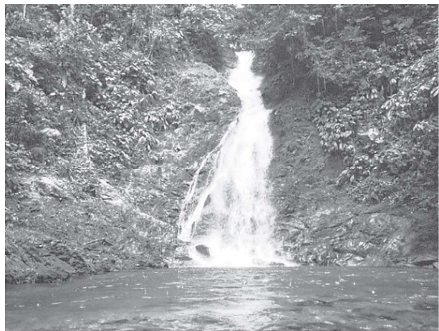
Figura 4. Reserva natural y ecoturística la Avispa.

lugar, precios del paquete y tiempo de duración. En las Figuras 4, 5 y 6 se presentan algunas fotografías de lugares turísticos con los que cuenta el departamento del Caquetá.