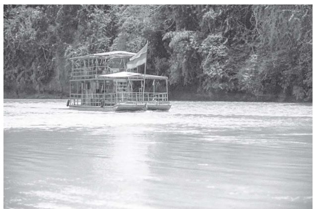
Figura 6. Ferry Marco Polo, Puerto Arango, recorrido por el Río Caquetá.

Los sitios turísticos identificados en los municipios objeto de estudio se presentan en la Tabla 2. En ellos se manifiestan las diferentes actividades que se pueden realizar.